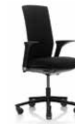
HÅG Futu 1020