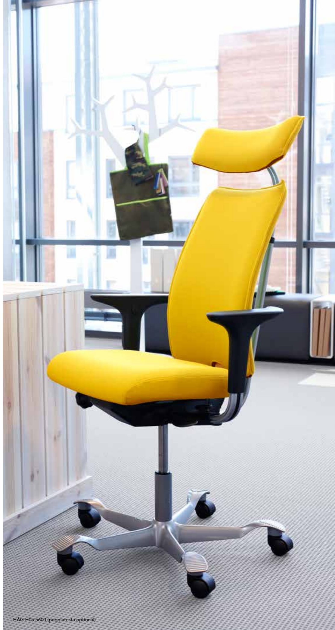
HÅG H05 5600 (poggiatesta optional)