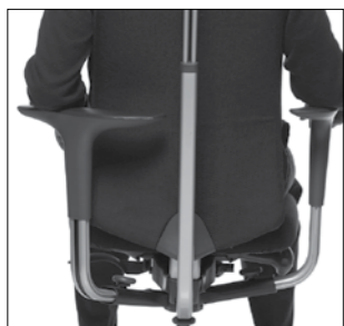
• Braccioli HÅG SwingBack®